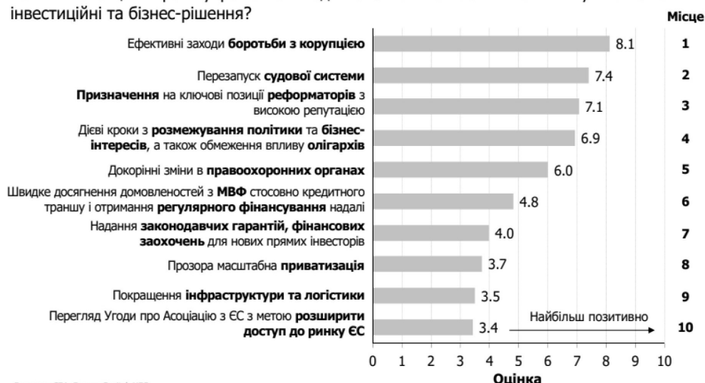
Рис. 2. Результати опитування про чинники, що позитивно впливають на інвестиційний клімат в Україні [5]

ПЗ. Які потенційні кроки української влади максимально позитивно вплинули б на ваші інвестиційні та бізнес-рішення?