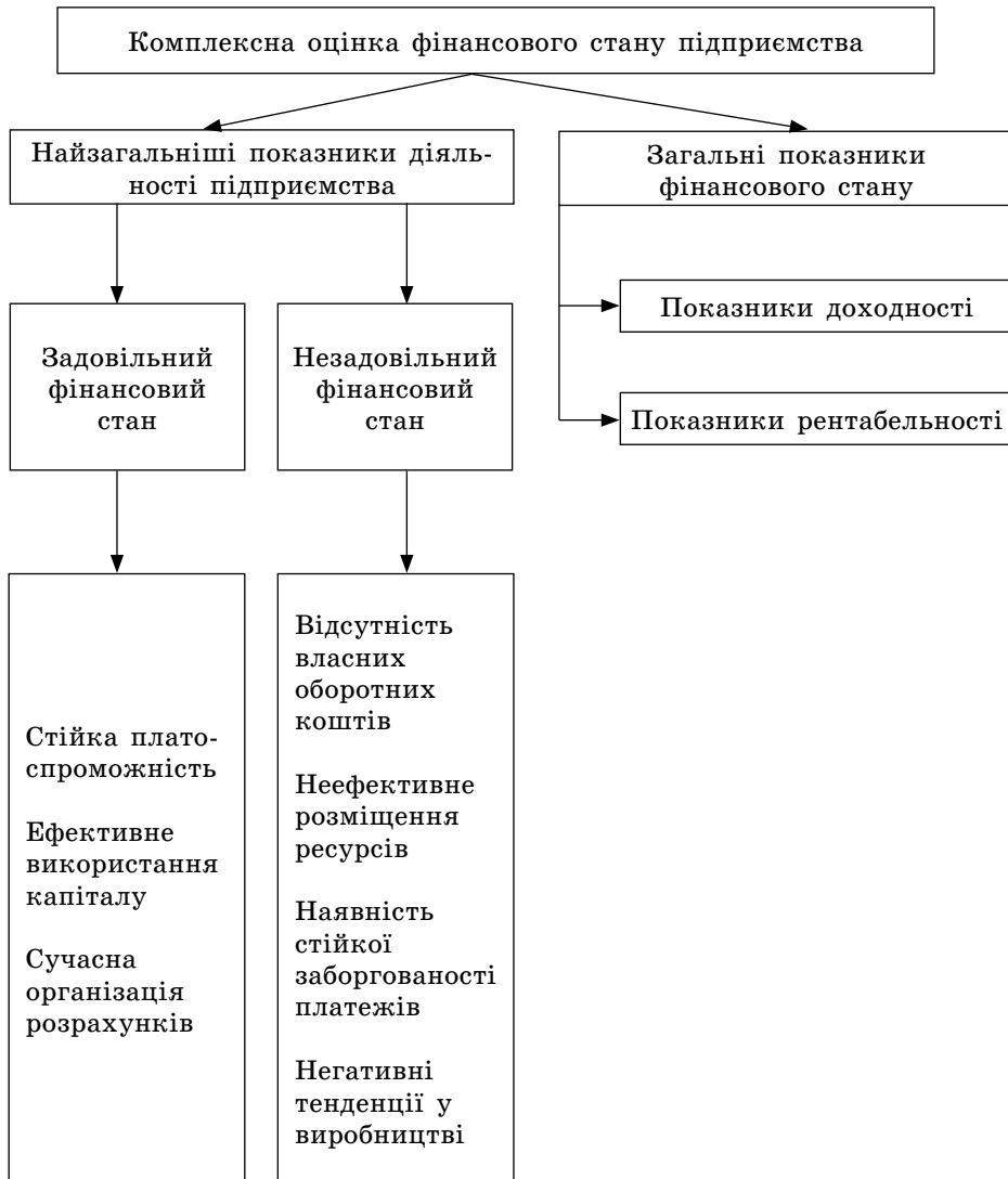
Рис. 1. Показники комплексної оцінки фінансового стану підприємства

Щодо інтегрального методу аналізу фінансового стану підприємства, то його слід використовувати тим підприємствам, які хочуть визначити свій фінансовий стан певним (одним, сукупним) інтегральним показником. Під час цього методу розраховується інтегральний показник на базі узагальнюючих показників за рівнем платоспроможності, фінансової незалежності та якості активів підприємства [4]. Перевагами цього методу є те, що сукупний (інтегральний) показник можна в будь-який момент доповнити будь-якою кількістю аналітичних напрямків та коефіцієнтів, що дає змогу тримати «руку на пульсі». Недоліком є те, що виникає певна неузгодженість понять «платоспроможність» та «ліквідність». Загальні показники інтегрального методу оцінки фінансового стану підприємства наведені на рис. 2.