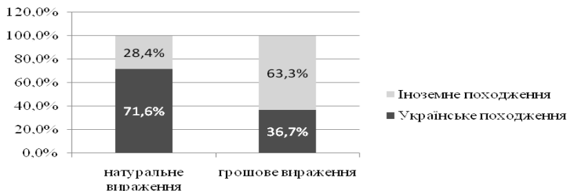
Рис.2. Структура походження лікарських засобів на ринку України

В 2011-14 роках темпи зростання фармацевтичного ринку в середньому становили 20% . Причому динаміка співвідношення іноземних і вітчизняних виробників (у товарній формі) поступово збільшується на користь останніх. Так, в 2014 році частка вітчизняних лікарських засобів склала 71,6% в натуральному вираженні і 36,7% в грошовому (рис.2).